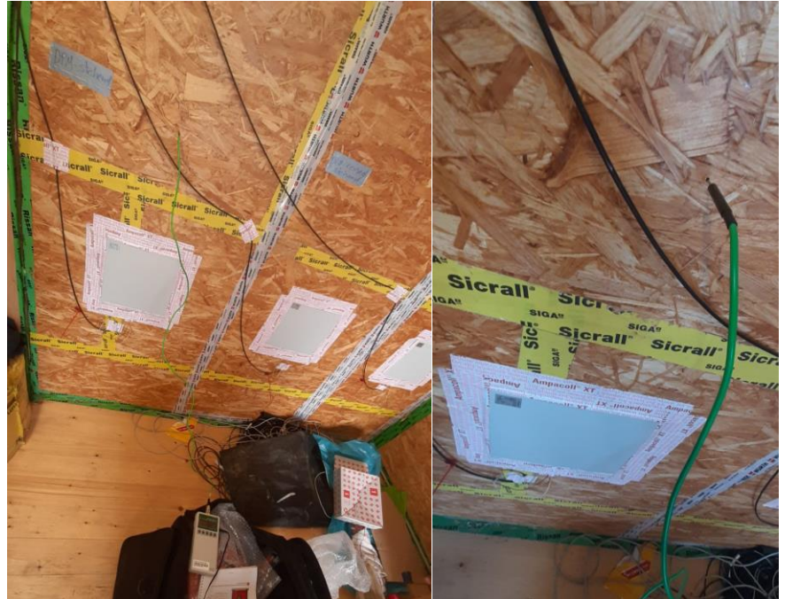
Abbildung 1: Messpunkte Positionen